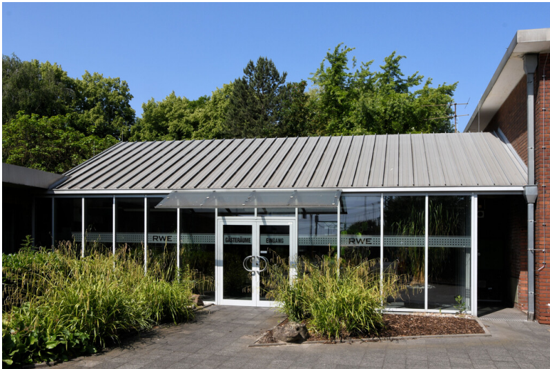
Kraftwerk Weisweiler: Kantine, Eingangshalle, Ansicht von Osten; Foto: 16.06.2023