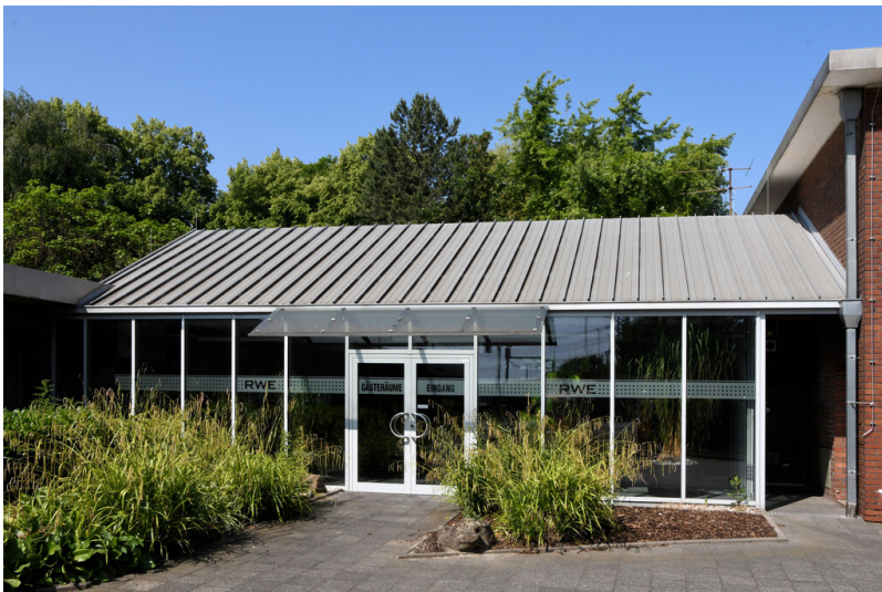
Kraftwerk Weisweiler: Kantine, Eingangshalle, Ansicht von Osten; Foto: 16.06.2023