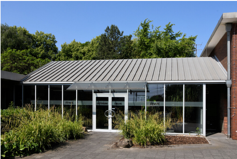
Kraftwerk Weisweiler: Kantine, Eingangshalle, Ansicht von Osten