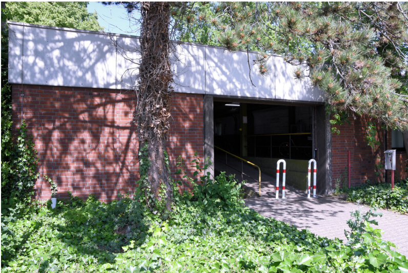
Kraftwerk Weisweiler: Fahrradschuppen, Zufahrt, Ansicht von Südosten; Foto: 16.06.2023