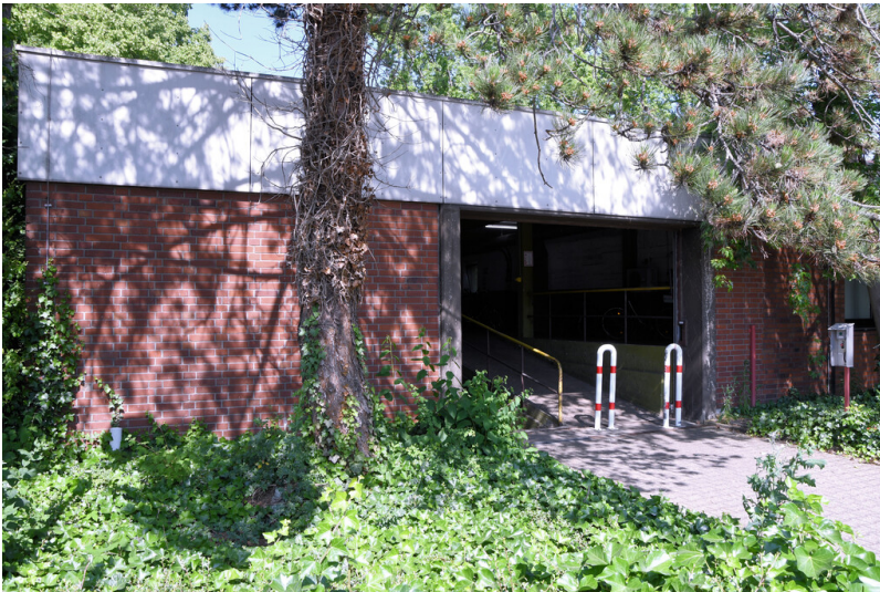
Kraftwerk Weisweiler: Fahrradschuppen, Zufahrt, Ansicht von Südosten