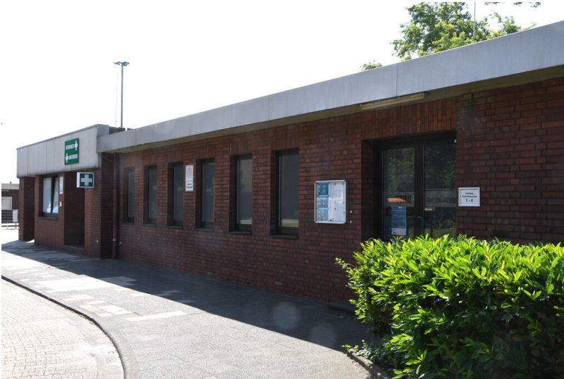
Kraftwerk Weisweiler: ehemaliges Pförtnergebäude, Bereich Sanitätsstation und Betriebsratstrakt, Ansicht von Westen; Foto: 16.06.2023