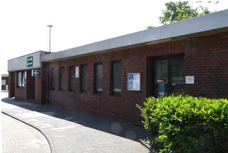
Kraftwerk Weisweiler: ehemaliges Pförtnergebäude, Bereich Sanitätsstation und Betriebsratstrakt, Ansicht von Westen; Foto: 16.06.2023