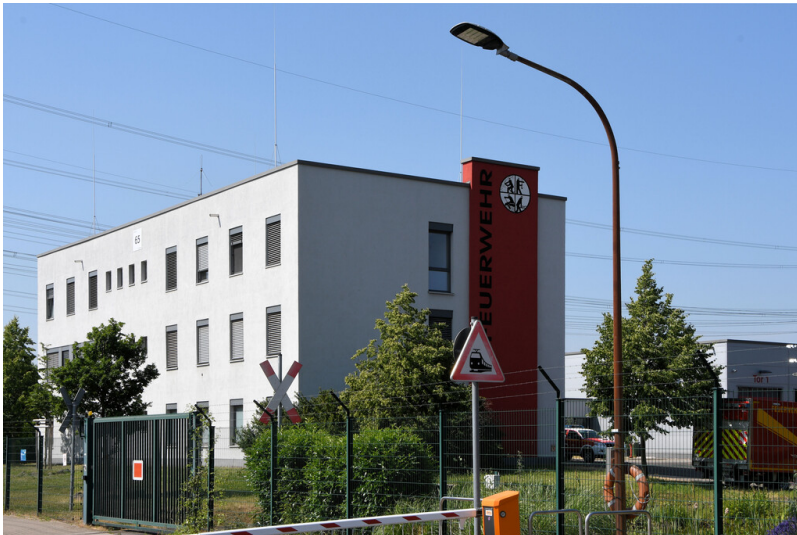
Kraftwerk Weisweiler: Neue Feuerwache, Verwaltungs- und Bereitschaftsgebäude, Ansicht von Nordosten