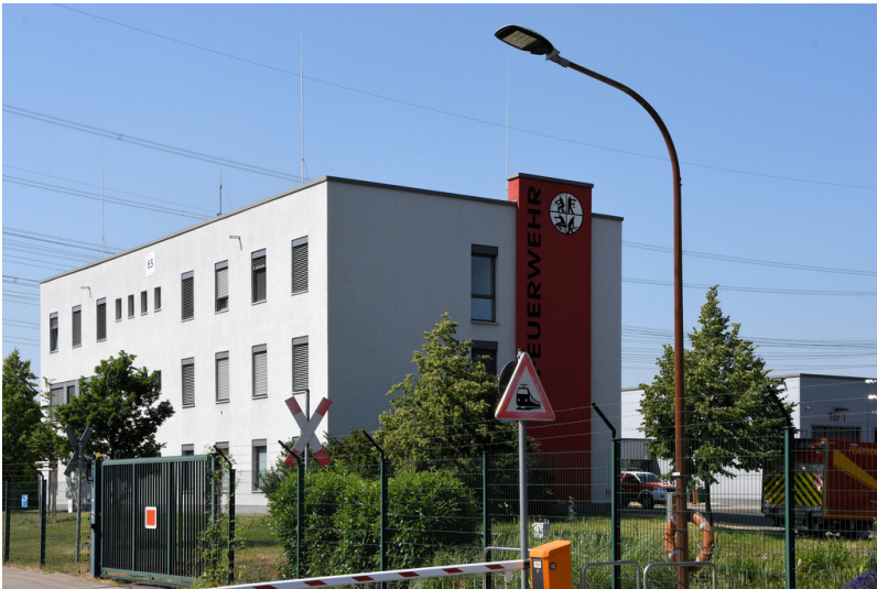
Kraftwerk Weisweiler: Neue Feuerwache, Verwaltungs- und Bereitschaftsgebäude, Ansicht von Nordosten