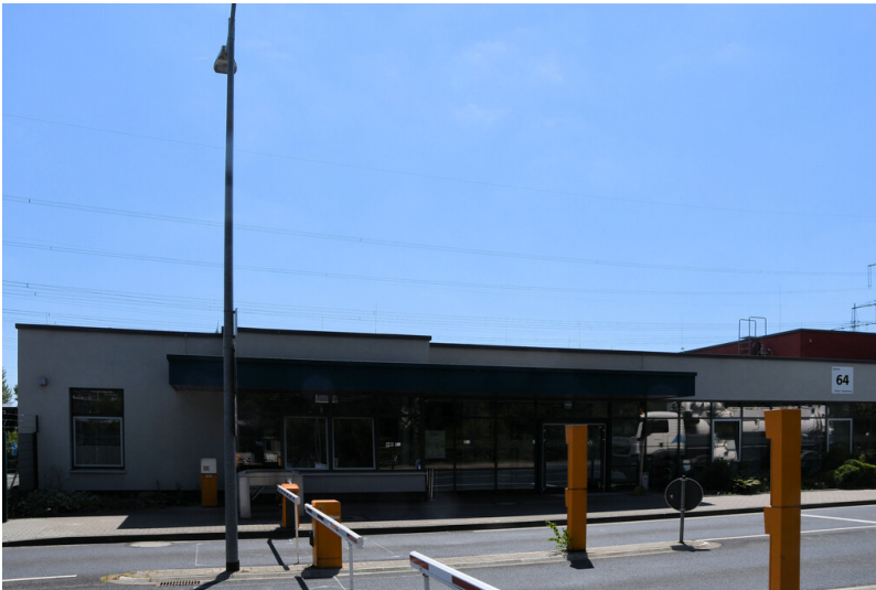
Kraftwerk Weisweiler: Pförtnergebäude, Eingangs- und Zufahrtsbereich, Ansicht von Norden; Foto: 13.06.2023