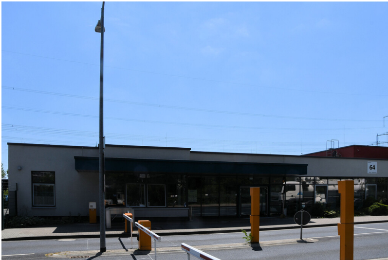
Kraftwerk Weisweiler: Pförtnergebäude, Eingangs- und Zufahrtsbereich, Ansicht von Norden; Foto: 13.06.2023