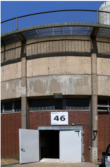
Kraftwerk Weisweiler: Schlammeindicker, Eingang, Ansicht von Süden