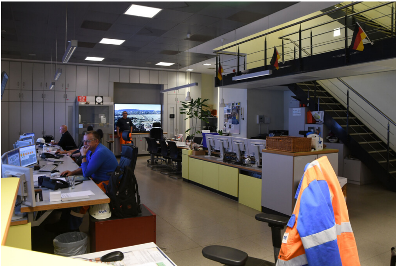
Kraftwerk Weisweiler: Wartengebäude G/H, Innenansicht; Foto: 16.06.2023