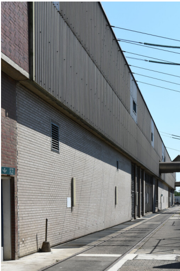
Kraftwerk Weisweiler: Schaltanlagenvorbau Block G, Ansicht von Südwesten