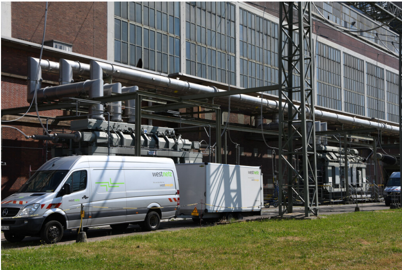
Kraftwerk Weisweiler: Schaltanlagenvorbau Block D, Ansicht (von Fahrzeug verdeckt) von Südwesten