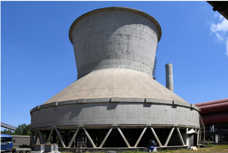
Kraftwerk Weisweiler: Kühlturm 12, Ansicht von Südwesten