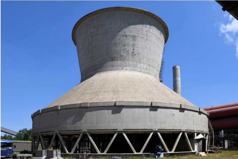
Kraftwerk Weisweiler: Kühlturm 12, Ansicht von Südwesten; Foto: 13.06.2023