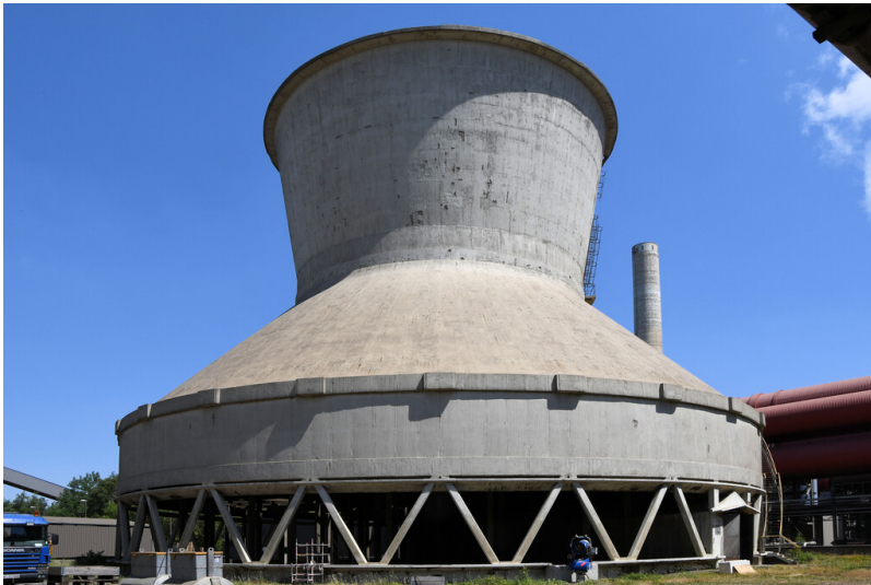
Kraftwerk Weisweiler: Kühlturm 12, Ansicht von Südwesten; Foto: 13.06.2023