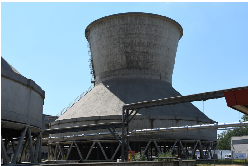
Kraftwerk Weisweiler: Kühlturm 10, Ansicht von Nordosten; Foto: 13.06.2023