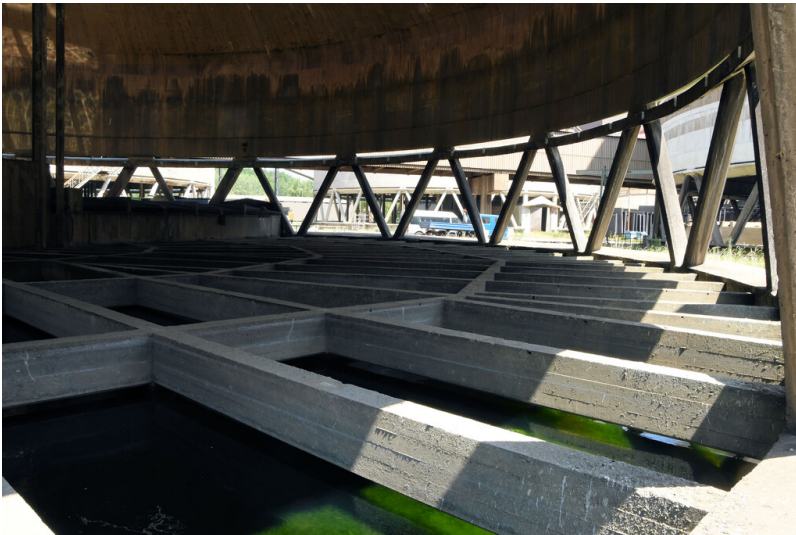
Kraftwerk Weisweiler: Kühlturm 6, Asbestzementeinbauten; Foto: 13.06.2023