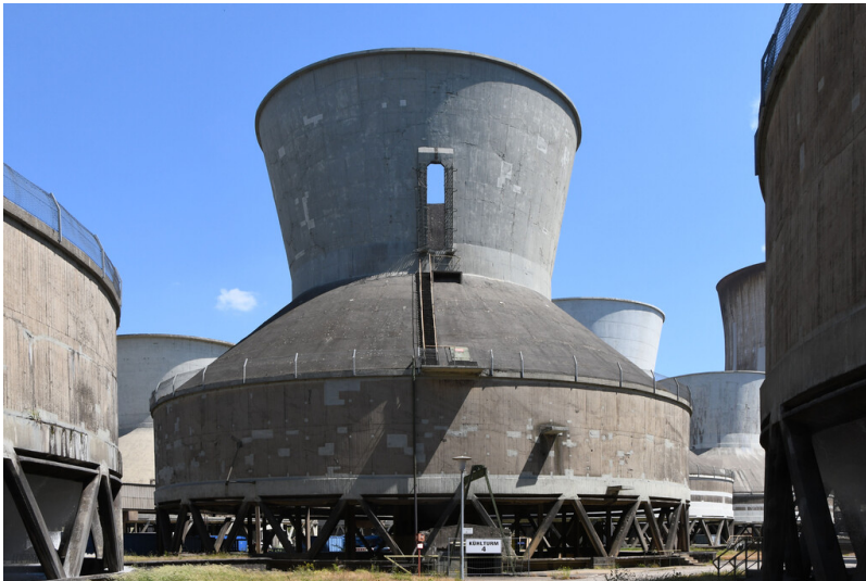
Kraftwerk Weisweiler: Kühlturm 4, Ansicht von Südwesten; Foto: 13.06.2023