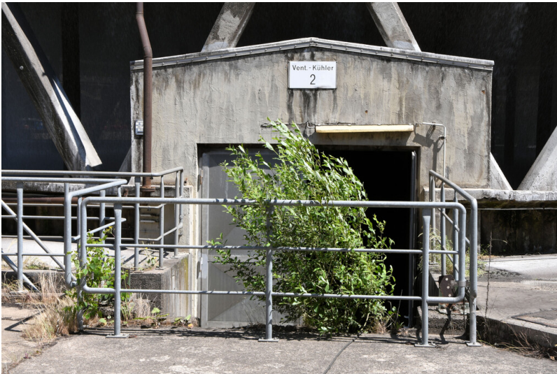
Kraftwerk Weisweiler: Kühlturm 2, Eingang zum Tunnel mit den Antriebsvorrichtungen; Foto: 13.06.2023