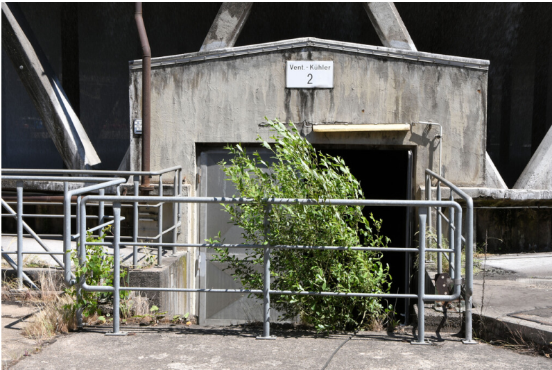
Kraftwerk Weisweiler: Kühlturm 2, Eingang zum Tunnel mit den Antriebsvorrichtungen; Foto: 13.06.2023