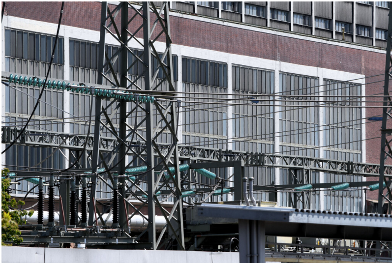
Kraftwerk Weisweiler: Maschinenhaus Block E, Ansicht von Südwesten; Foto: 13.03.2023