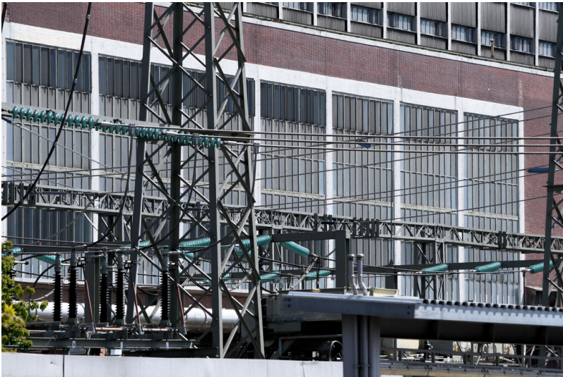
Kraftwerk Weisweiler: Maschinenhaus Block E, Ansicht von Südwesten; Foto: 13.03.2023