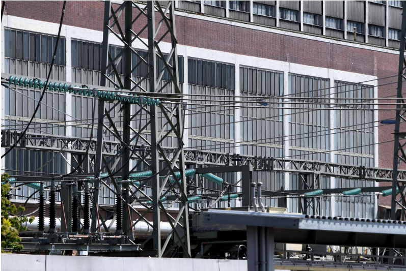
Kraftwerk Weisweiler: Maschinenhaus Block E, Ansicht von Südwesten