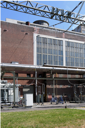
Kraftwerk Weisweiler: Maschinenhaus, Block D, Ansicht von Südwesten; Foto: 13.03.2023