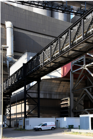
Kraftwerk Weisweiler: Elektrofilter von Block H, Ansicht von Nordosten; Foto: 16.06.2023