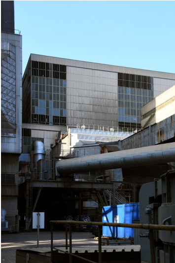
Kraftwerk Weisweiler: Kesselhaus Block F, Ansicht von Norden; Foto: 16.06.2023