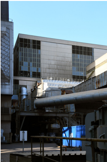
Kraftwerk Weisweiler: Kesselhaus Block F, Ansicht von Norden