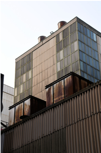
Kraftwerk Weisweiler: Kesselhaus Block D, Ansicht von Nordwesten