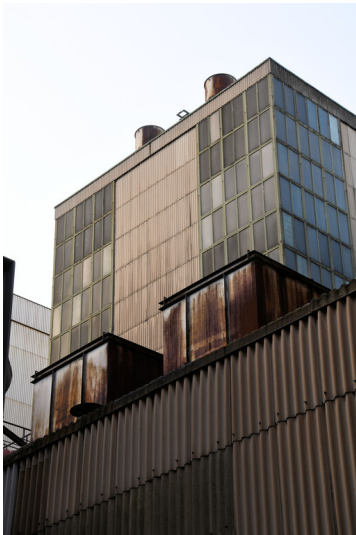
Kraftwerk Weisweiler: Kesselhaus Block D, Ansicht von Nordwesten