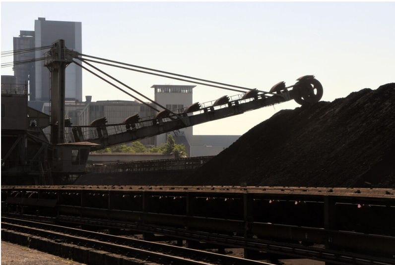
Kraftwerk Weisweiler: Eisenausscheidung 5/6 (im Hintergrund), Ansicht von Norden