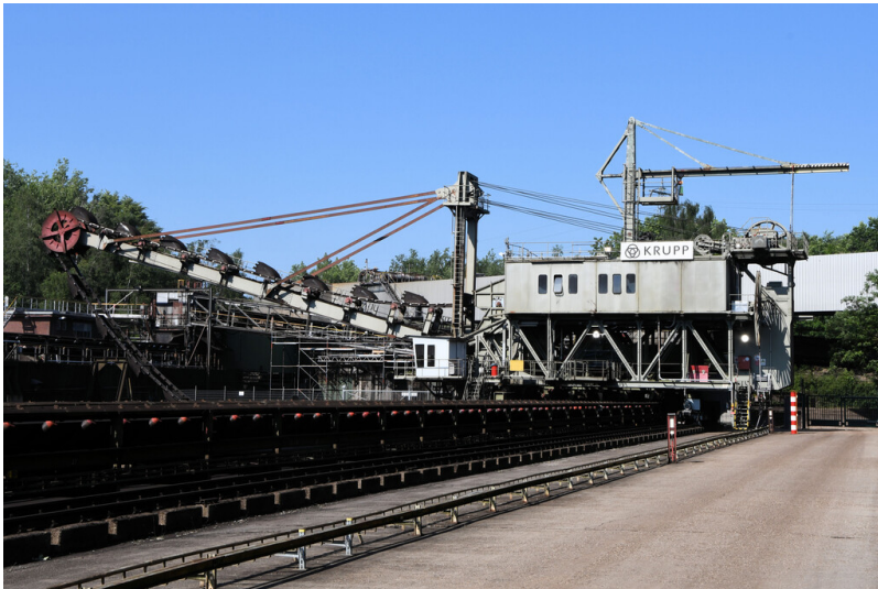
Kraftwerk Weisweiler: Grabenbunker 3, Bunkerbagger 6, Ansicht von Nordosten; Foto: 13.06.2023