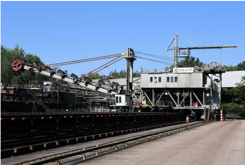
Kraftwerk Weisweiler: Grabenbunker 3, Bunkerbagger 6, Ansicht von Nordosten; Foto: 13.06.2023