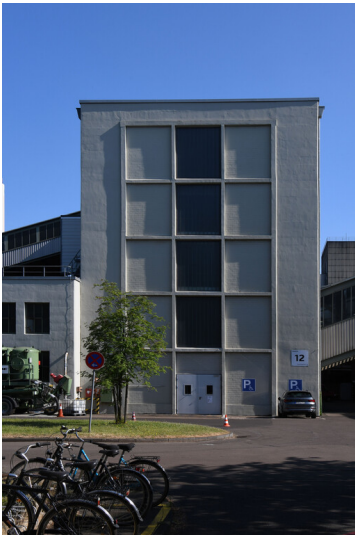
Kraftwerk Weisweiler: Brecherei 3/4, Altgebäude von 1954/55, Ansicht von Süden; Foto: 13.06.2023