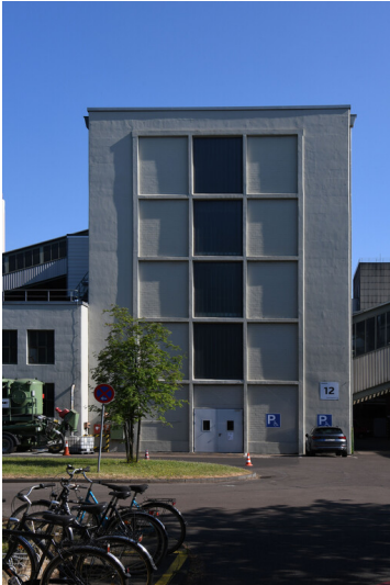
Kraftwerk Weisweiler: Brecherei 3/4, Altgebäude von 1954/55, Ansicht von Süden; Foto: 13.06.2023