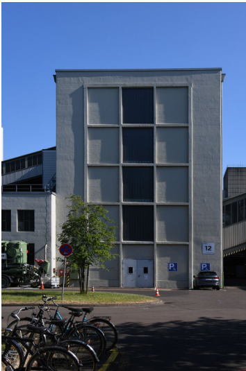
Kraftwerk Weisweiler: Brecherei 3/4, Altgebäude von 1954/55, Ansicht von Süden; Foto: 13.06.2023