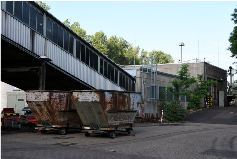
Kraftwerk Weisweiler: Eisenausscheidung 3/4, Bandbrücke zur Brecherei 3/4, Ansicht von Nordosten; Foto: 16.06.2023