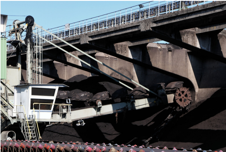
Kraftwerk Weisweiler: Bunkerbagger 3 in Grabenbunker 2, Tragarm mit durchhängender Eimerkette, Ansicht von Osten; Foto: 13.06.2023