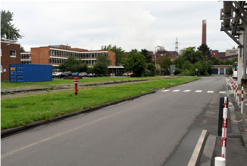
Kraftwerk Niederaußem: Maschinenhausstraße, vor der Werkstatt verlaufend, Ansicht von Osten; Foto: 15.08.2023