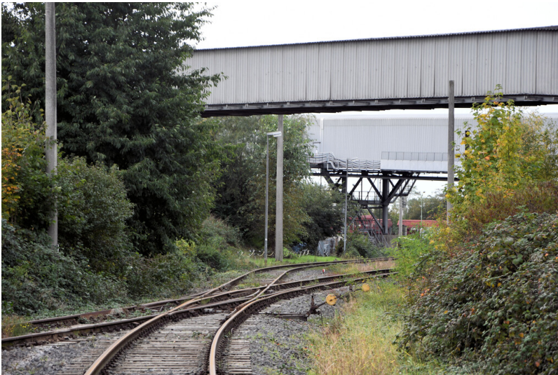
Kraftwerk Niederaußem: Zufahrtsgleis zum Lokschuppen, Abzweig des gemeinsamen Asche- und Lokschuppengleises (vorne im Bild) vom Schwerbau-, Maschinenhaus- und Trafogleis, Ansicht von Osten