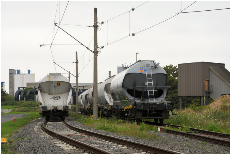
Kraftwerk Niederaußem: Gipsgleise, Zufahrt zur Gipsverladung, Ansicht von Süden; Foto: 17.08.2023