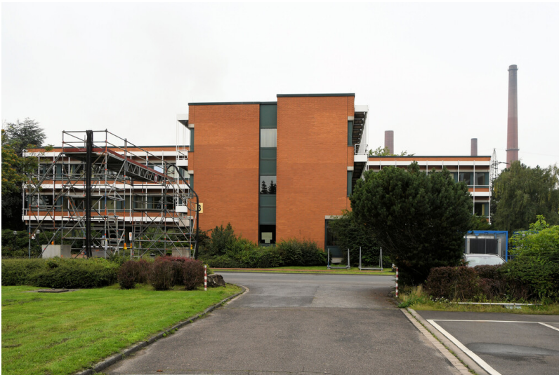
Kraftwerk Niederaußem: Verwaltungsgebäude, östlicher Flügelbau, Ansicht von Nordosten; Foto: 17.08.2023