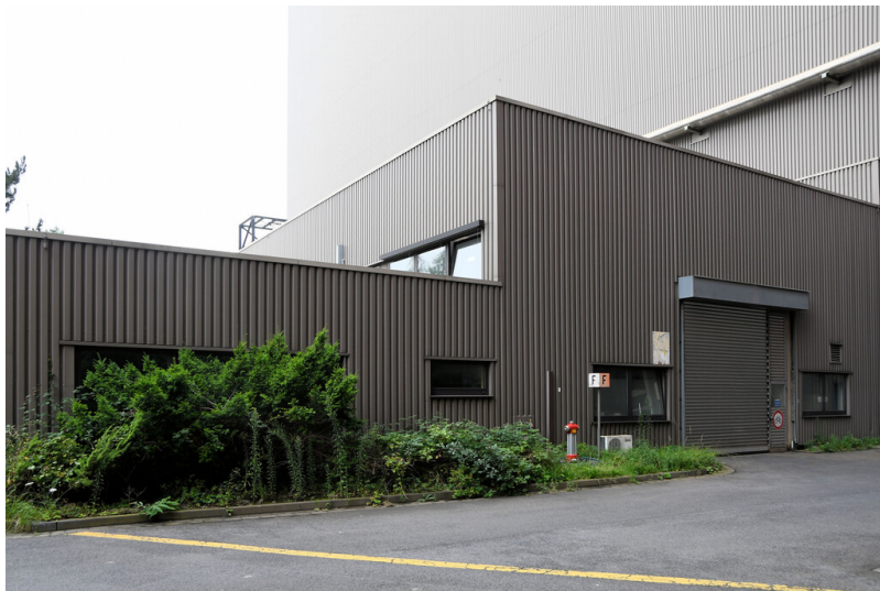
Kraftwerk Niederaußem: REA-Werkstatt mit Büros, Ansicht von Süden; Foto: 17.08.2023