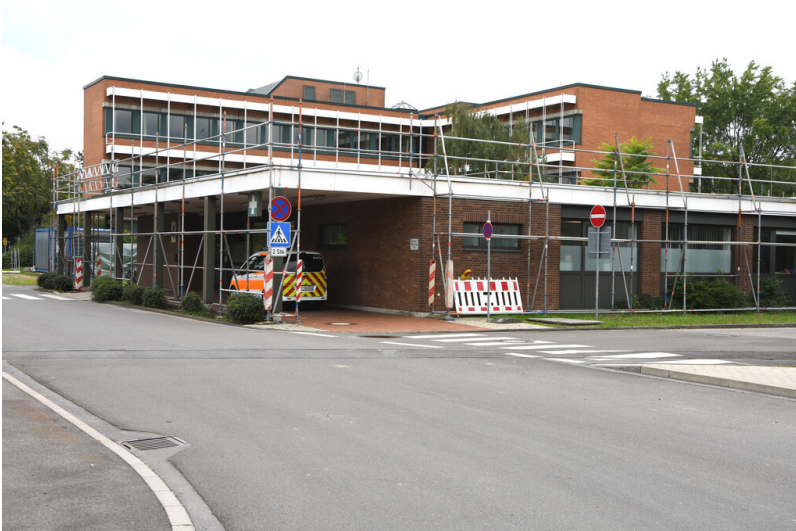
Kraftwerk Niederaußem: Sanitätsstation, Ansicht von Norden; Foto: 15.08.2023