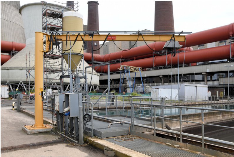
Kraftwerk Niederaußem: Rotasche-Absetzbecken, Drehkran, Ansicht von Westen