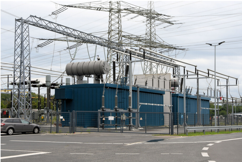
Kraftwerk Niederaußem: Querregler, Ansicht von Nordwesten; Foto: 15.08.2023