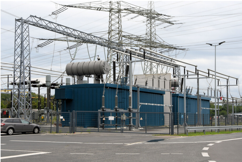
Kraftwerk Niederaußem: Querregler, Ansicht von Nordwesten; Foto: 15.08.2023