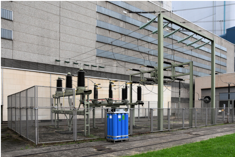
Kraftwerk Niederaußem: Anfahranlage 4, Schaltfeld, Ansicht von Süden; Foto: 17.08.2023