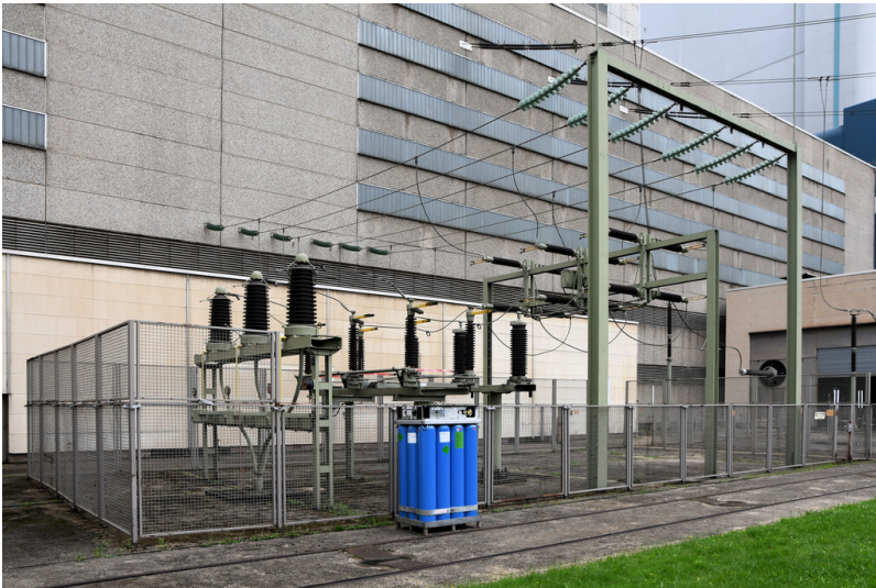
Kraftwerk Niederaußem: Anfahranlage 4, Schaltfeld, Ansicht von Süden