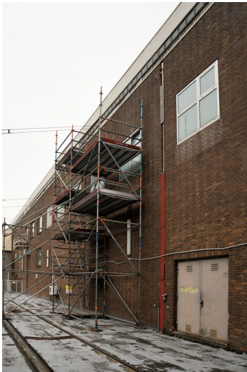
Kraftwerk Niederaußem: Schaltanlagenvorbau, Block D, Ansicht von Südosten; Foto: 17.08.2023