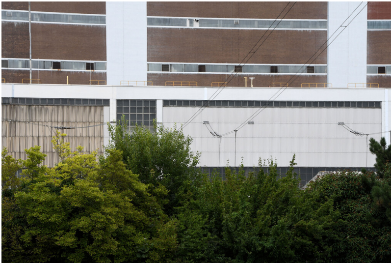
Kraftwerk Niederaußem: Maschinenhaus Block E, Ansicht von Süden