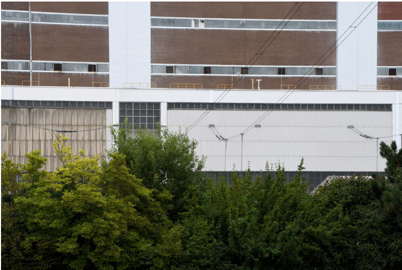
Kraftwerk Niederaußem: Maschinenhaus Block E, Ansicht von Süden