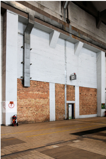
Kraftwerk Niederaußem: Maschinenhaus Block C1/C2, Schwerbauseite, Innenansicht von Südwesten; Foto: 15.08.2023