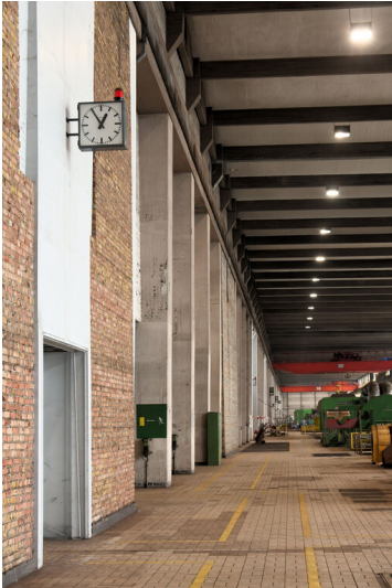
Kraftwerk Niederaußem: Maschinenhaus, Schwerbauseite, Innenansicht von Westen vom Standpunkt Block A; Foto: 15.08.2023