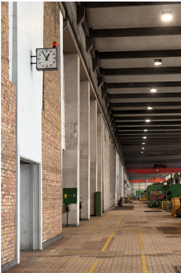
Kraftwerk Niederaußem: Maschinenhaus, Schwerbauseite, Innenansicht von Westen vom Standpunkt Block A; Foto: 15.08.2023