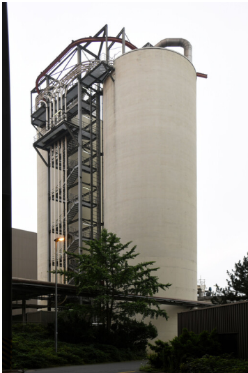
Kraftwerk Niederaußem: Kalksilos, Ansicht von Osten; Foto: 17.08.2023