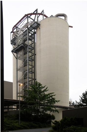
Kraftwerk Niederaußem: Kalksilos, Ansicht von Osten; Foto: 17.08.2023