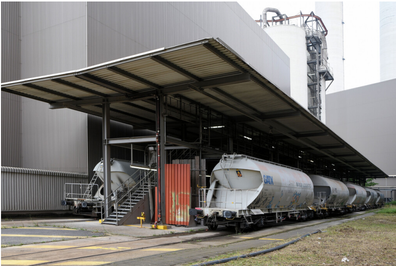
Kraftwerk Niederaußem: Kalkbahnhof, Ansicht von Süden; Foto: 17.08.2023