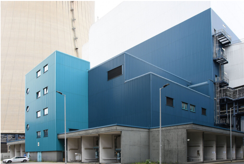
Kraftwerk Niederaußem: Schaltanlagegebäude 2, Ansicht von Südwesten; Foto: 15.08.2023