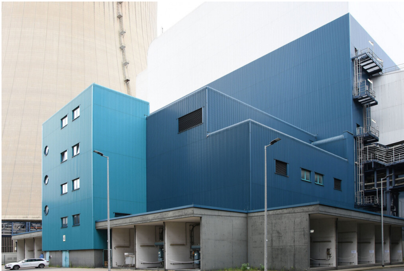
Kraftwerk Niederaußem: Schaltanlagegebäude 2, Ansicht von Südwesten; Foto: 15.08.2023