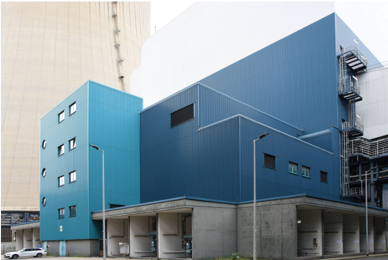
Kraftwerk Niederaußem: Schaltanlagegebäude 2, Ansicht von Südwesten; Foto: 15.08.2023