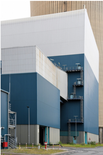
Kraftwerk Niederaußem: REA-Gebäude Block K, Einleitung eines Rauchgaskanals aus dem Saugzuggebäude, Ansicht von Südosten; Foto: 15.08.2023