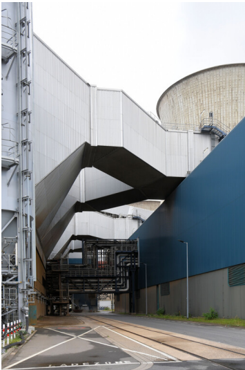
Kraftwerk Niederaußem: Elektrofilter Block K, Ausgänge zum Saugzuggebäude, Ansicht von Osten; Foto: 15.08.2023