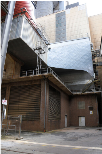
Kraftwerk Niederaußem: Elektrofilter Block G, Ansicht von Nordwesten; Foto: 15.08.2023