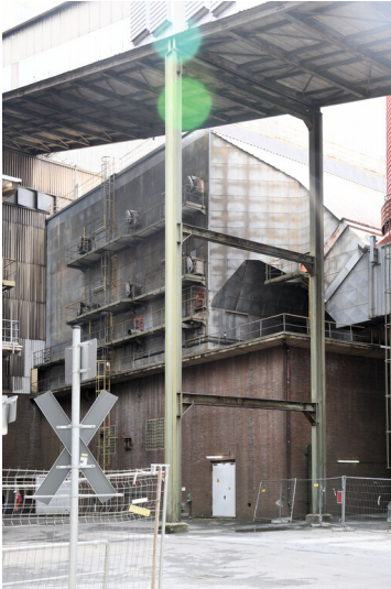
Kraftwerk Niederaußem: Elektrofilter Block F, Ansicht von Norden