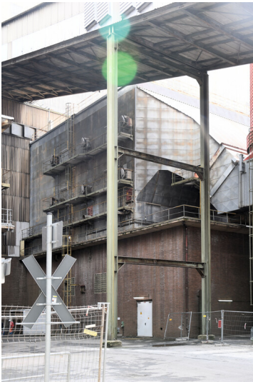
Kraftwerk Niederaußem: Elektrofilter Block F, Ansicht von Norden