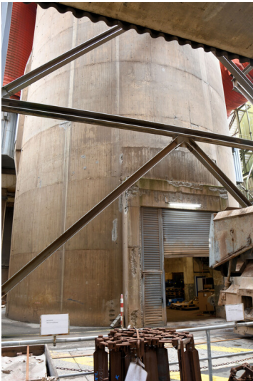
Kraftwerk Niederaußem: Schornstein Block E, Stahlbetonunterbau, Ansicht von Norden; Foto: 15.08.2023