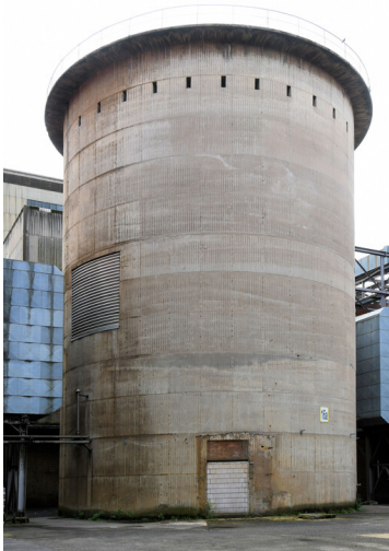
Kraftwerk Niederaußem: Schornstein-Fundamentsockel Blöcke A/B, Ansicht von Norden