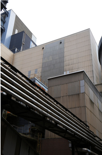
Kraftwerk Niederaußem: Kesselhaus Block F, Ansicht von Nordwesten; Foto: 15.08.2023