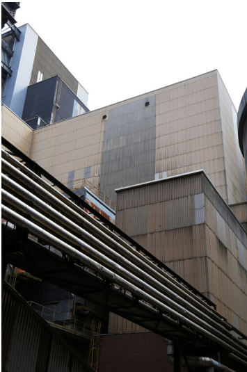
Kraftwerk Niederaußem: Kesselhaus Block F, Ansicht von Nordwesten; Foto: 15.08.2023