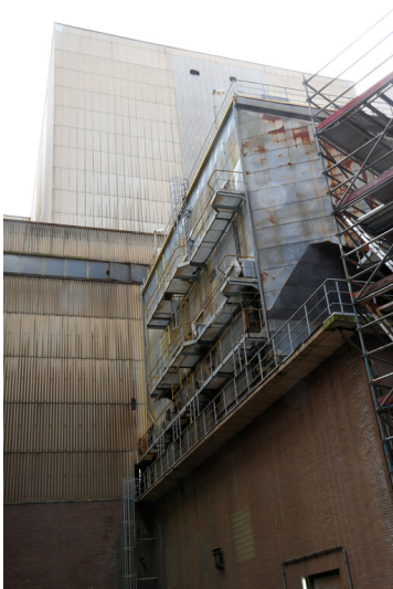
Kraftwerk Niederaußem: Kesselhaus Block E, Ansicht von Norden