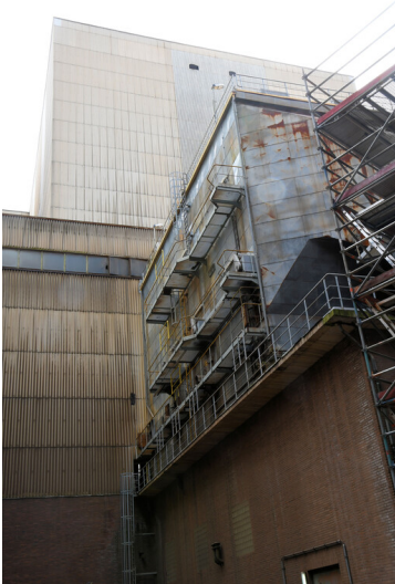
Kraftwerk Niederaußem: Kesselhaus Block E, Ansicht von Norden; Foto: 15.08.2023