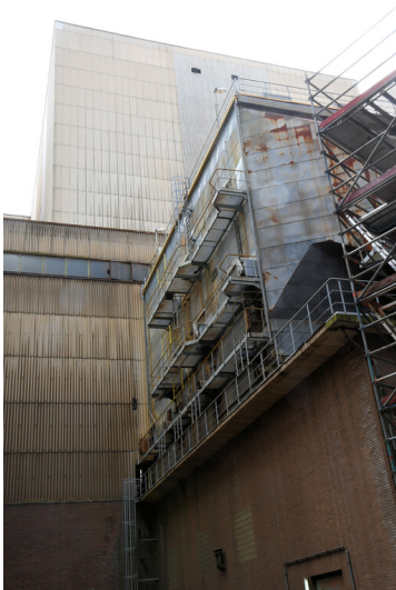
Kraftwerk Niederaußem: Kesselhaus Block E, Ansicht von Norden; Foto: 15.08.2023