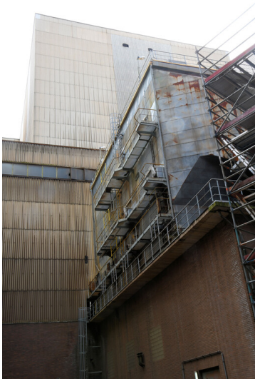
Kraftwerk Niederaußem: Kesselhaus Block E, Ansicht von Norden; Foto: 15.08.2023