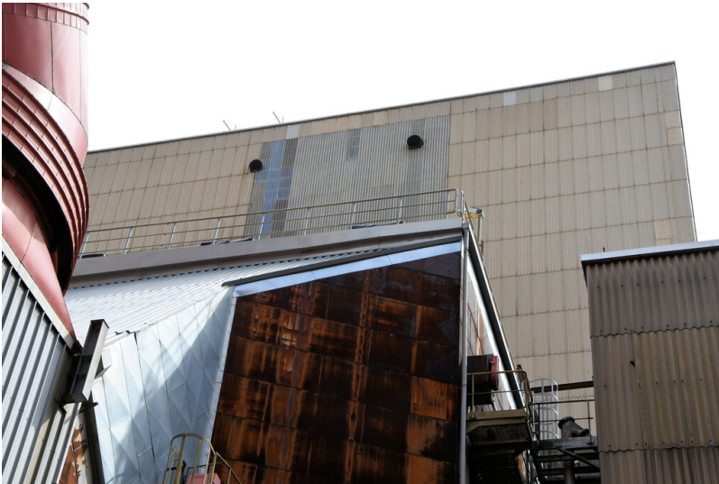
Kraftwerk Niederaußem: Kesselhaus Block D, Ansicht von Nordwesten; Foto: 15.08.2023