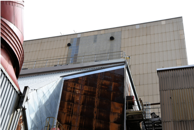
Kraftwerk Niederaußem: Kesselhaus Block D, Ansicht von Nordwesten