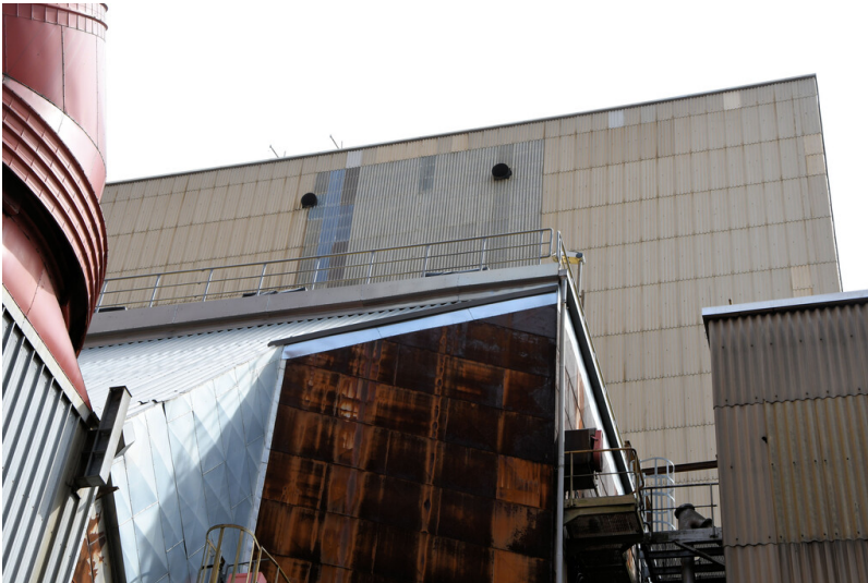
Kraftwerk Niederaußem: Kesselhaus Block D, Ansicht von Nordwesten; Foto: 15.08.2023