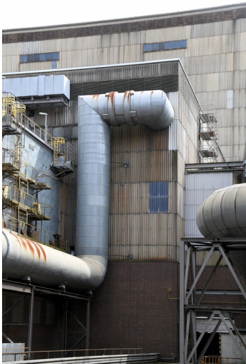
Kraftwerk Niederaußem: Kesselhaus Block C1/C2, Ansicht von Nordwesten; Foto: 15.08.2023