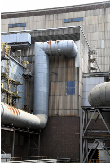
Kraftwerk Niederaußem: Kesselhaus Block C1/C2, Ansicht von Nordwesten; Foto: 15.08.2023