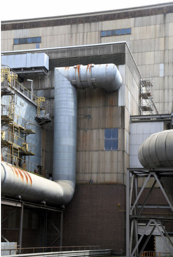
Kraftwerk Niederaußem: Kesselhaus Block C1/C2, Ansicht von Nordwesten